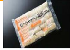
卷心菜包裹鸡肉糜的产品，形状饱满，鲜嫩多汁。