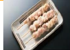
优质的气蒸鸡腿肉串，可加上喜欢的调味料，口味更佳。