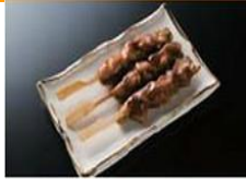
优质的碳烤鸡腿肉串。