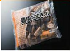
精选糯米与鸡肉组合制作而成的鸡肉粽子。