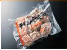
美味多汁的烤鸡肉腿排，有胡椒、酱油、柠檬3种口味，可用煎锅调理。